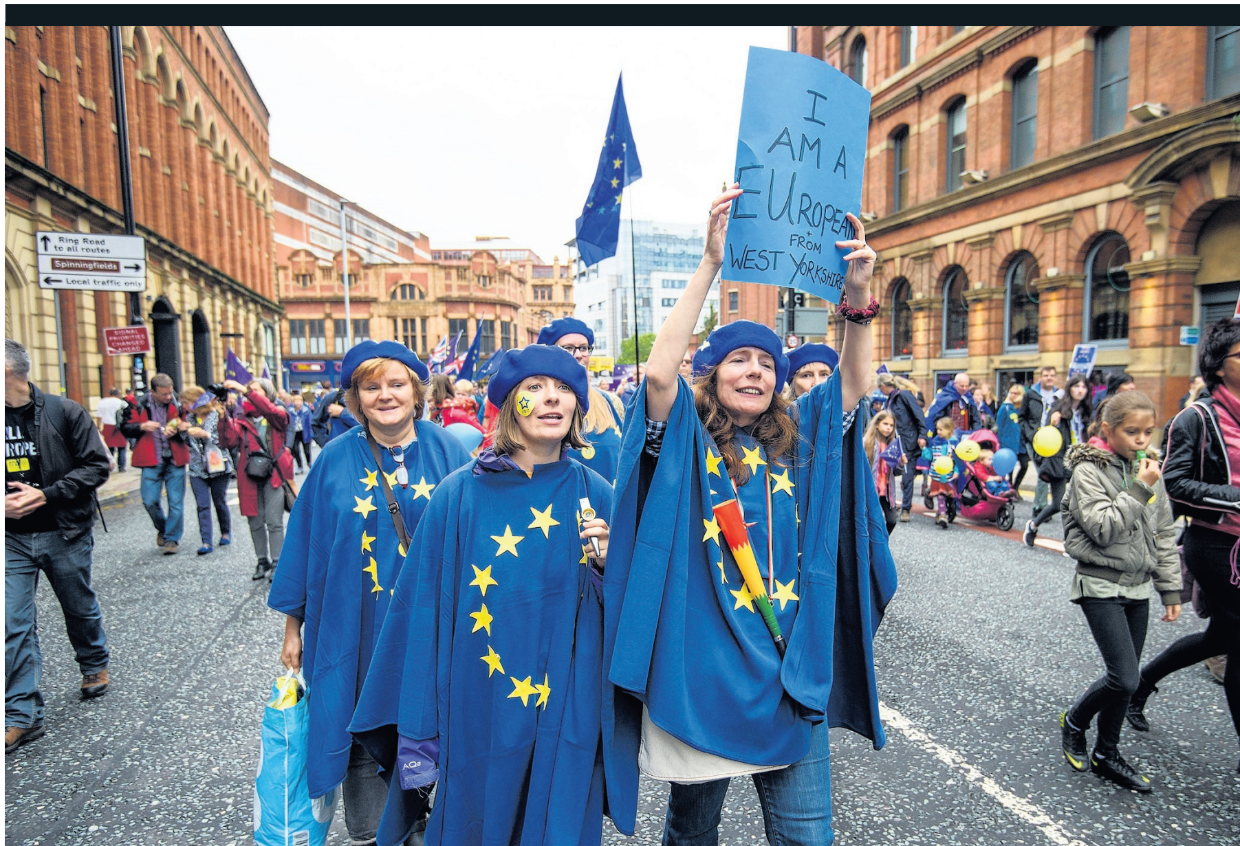
→ Protesten tegen brexit in Manchester.