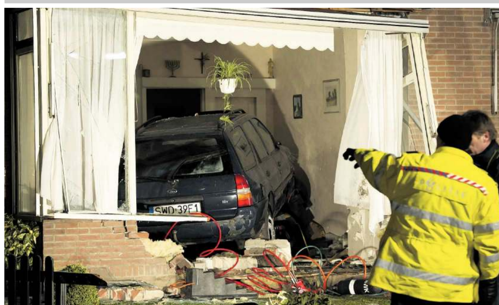
Politie verricht onderzoek bij de woning in Noordwijk waar zaterdag tegen middernacht een auto met een Poolse kenteken het huis in reed.

De bedoeling is dat komende zomer ook normen voor andere chirurgische behandelingen worden gepubliceerd. De nieuwe normen vormen een standaard, maar ze zijn, aldus een woordvoerder van Heelkunde, niet statisch. Op basis van de registratie zullen ze steeds verder worden aangescherpt.